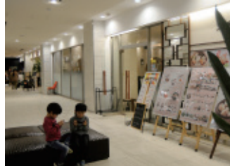
B1 レストランフロアの大きなソファ