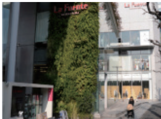
施設エントランス前もゆったり