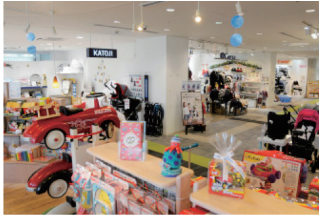
本館2階は全てが、ベビー&キッズの店舗